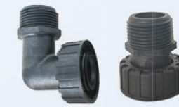
进出水口快接 QC for inlet/outlet