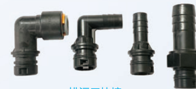
排污口快接 QC for drain line