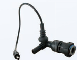
树脂消毒装置 Optional chlorine producer module